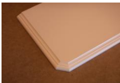
Flexi med brutet hörn